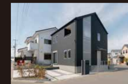
> 北足立郡伊奈町西小針 1丁目 53-4