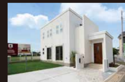
> 桶川市坂田 1687-13 付近