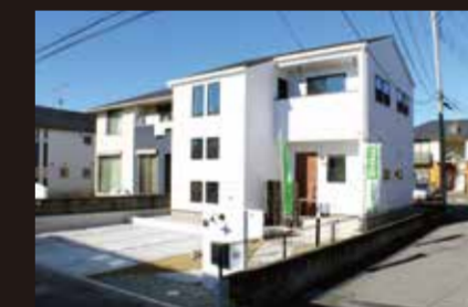
> 鴻巣市大間 4丁目 27-24 付近