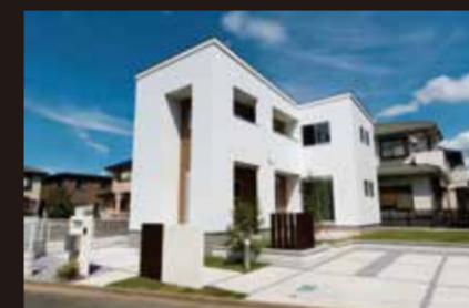
> 蓮田市綾瀬 2345-2